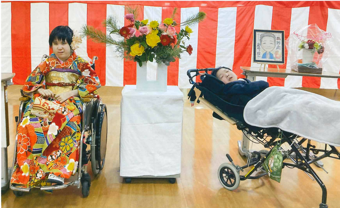
R7年1月16日 成人お祝い会 (第1病棟)